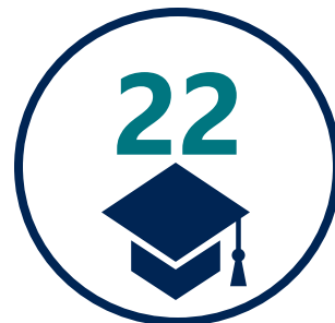
Локальных академических партнера